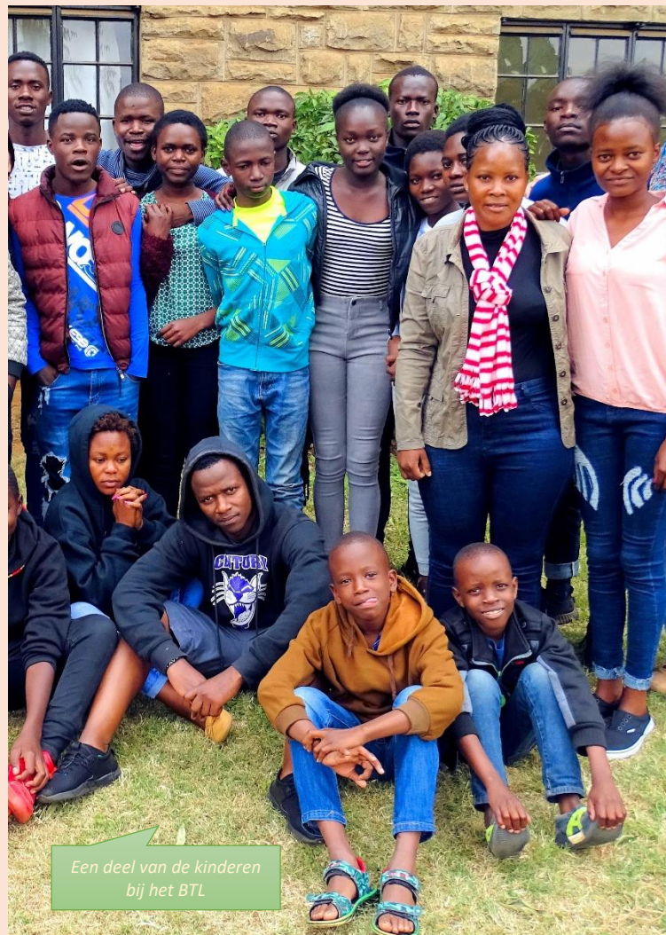
Een deel van de kinderen bij het BTL

aandacht voor elkaar. Dat waren ze nooit gewend, maar ze zijn op elkaar gaan letten en praten over hun pijn zodra