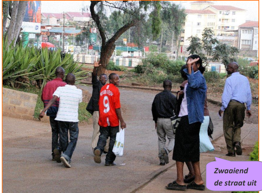
Zwaaierend de straat uit

ze elkaar nu en dan ontmoeten en elkaar regelmatig bellen. We krijgen de indruk dat ze denken dat er geen hulp meer voor hen is, nu ze het kindertehuis uit zijn. We moedigen hen aan om