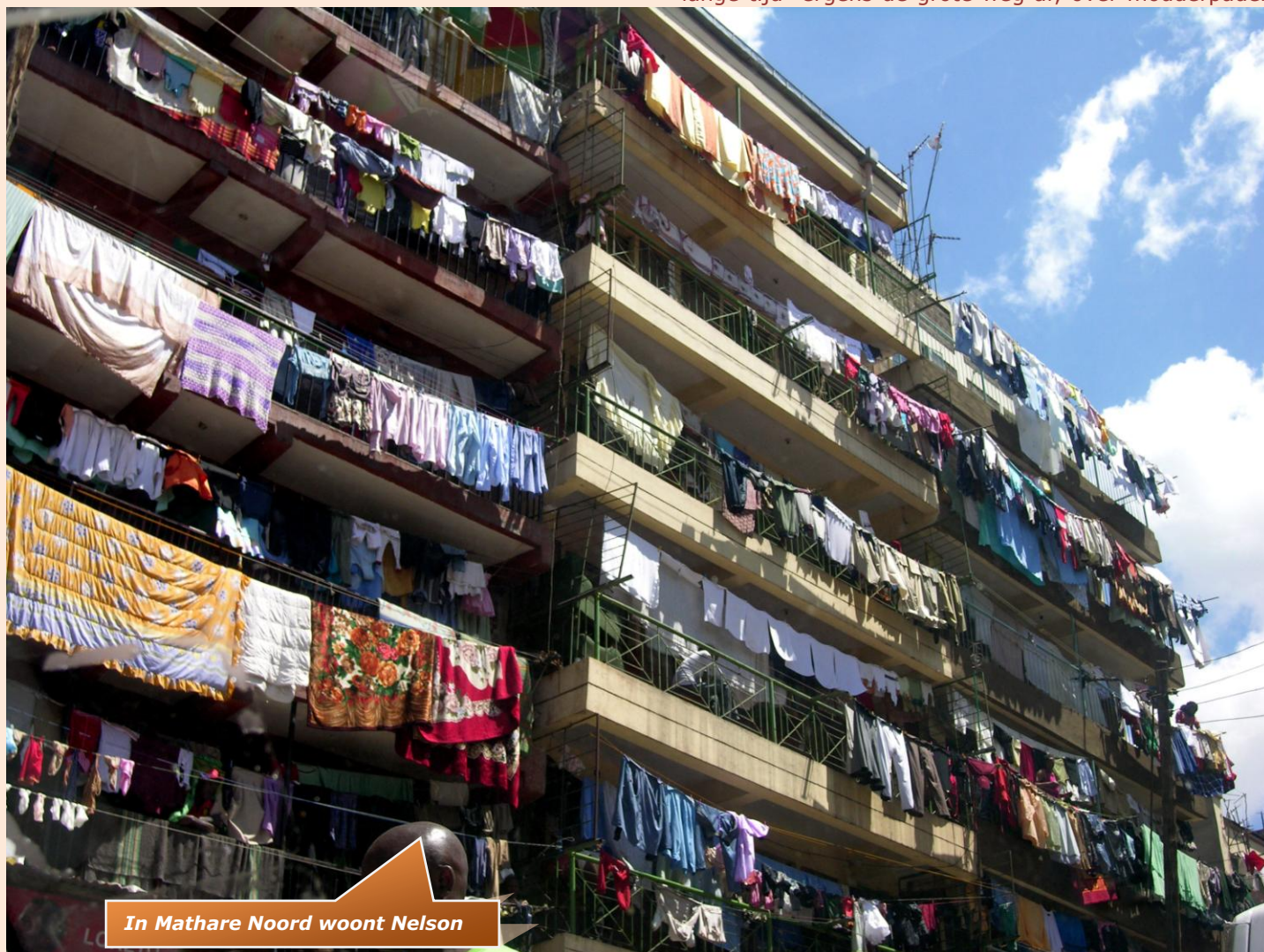
In Mathare Noord woont Nelson

op een afgesproken plek in de stad op en we rijden de stad uit. Deels door industriegebied, maar ook door prachtige Afrikaanse landschappen. Dan gaan we na lange tijd ergens de grote weg af, over modderpaden