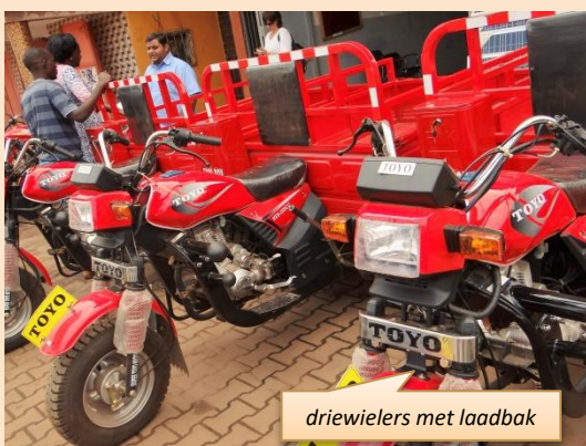
driewielers met laadbak

landbouw en horeca. Meisjes die hun basisschool of het voortgezet onderwijs hebben afgerond, kunnen instromen in