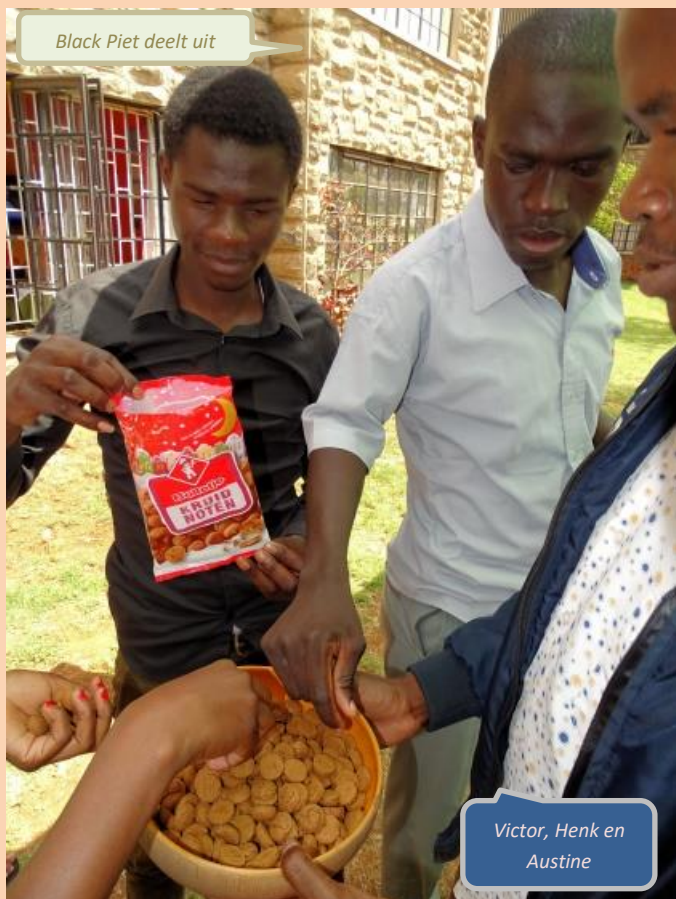
Black Piet deelt uit

Ik ben bij een soort weeshuis geweest. Het is alleen een ander soort weeshuis dan een normaal weeshuis. Dit is een project van mensen uit Nederland, waar mijn moeder bekend mee is; zij sponsort hen vanuit Nederland. Het weeshuis is eigenlijk een grote familie. Het voelde ook echt als een grote familie in plaats van een weeshuis. Er wordt zo nauw met ze samengewerkt. Ze worden ondersteund tot ze zichzelf kunnen onderhouden en ze worden ondersteund in alles. Dus niet alleen eten en onderdak maar ook educatie etc. Ik ben er een dagje geweest en heb met veel van de mensen die er wonen gepraat. Ik vind het zo tof om te zien wat ze doen voor de wezen in dit huis. Het is zo'n goed georganiseerd gebeuren. Heel goed werk leveren ze en de wezen in het huis zijn heel erg dankbaar en heel gelukkig. Dus