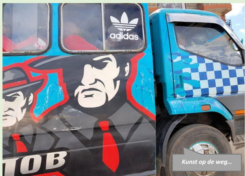
Kunst op de weg...

aardse vormt ons voor het hemelse. Ook stoppen met het leven bij de dag, maar leren om dingen in de tijd te zetten. Geen korte, maar lange termijn denken . Denk niet langer dat je morgen wel dood kunt zijn, maar leer te verstaan