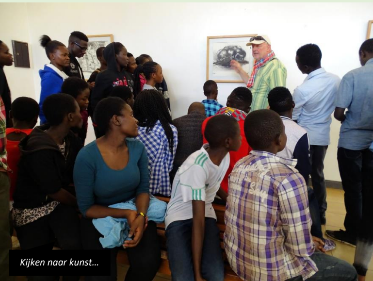
Kijken naar kunst...