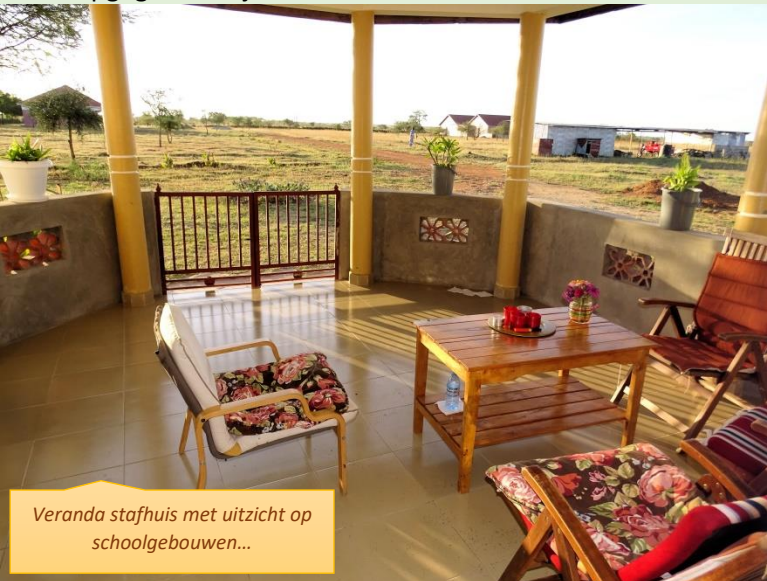
Veranda stafhuis met uitzicht op schoolgebouwen...

Avonds helpen de ouders de jongeren met hun huiswerk. Er is zorg voor elkaar en er wordt enorm veel gelachen. Tijdens de zondagen waarop wij er zijn, komen ook nog enige jong volwassenen ons bezoeken, die eerder opgegroeid zijn in het kinderkuis. Ze vertellen dat het