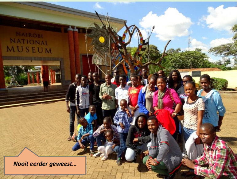
Nooit eerder geweest...

dat je nu al dood bent als je geen toekomst geeft aan de armen om je heen. Neem de woorden van Zijn aardse broer Jacobus serieus, dat de boel dood is zodra je ophoudt te doen: geef zorg aan elkaar, geef zorg aan weduwe, wees en vluchteling. Zorg voor ieder die arm is en sticht een kerk van en voor de armen. Ga niet als goden leven van het geld dat bedoeld is voor de armen. Stop met het bouwen van kerkgebouwen en blijf in kleine groepen in de huizen en de hutten. We praten over hun toekomst en laten ze zien dat de historie van de kerk leert