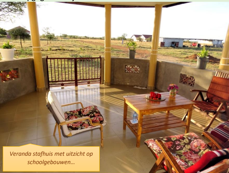
Veranda staphuis met uitzicht op schoolgebouwen...

Avonds helpen de ouders de jongeren met hun huiswerk. Er is zorg voor elkaar en er wordt enorm veel gelachen. Tijdens de zondagen waarop wij er zijn, komen ook nog enige jong volwassenen ons bezoeken, die eerder opgegroeid zijn in het kindertehuis. Ze vertellen dat het