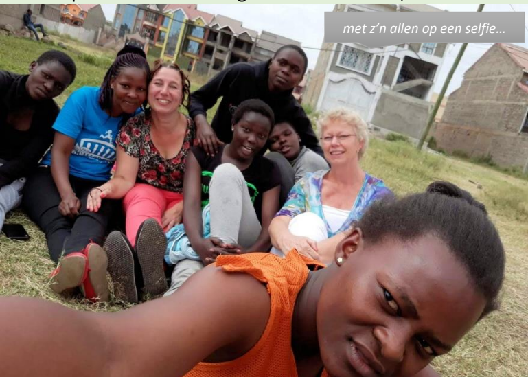
met z'n allen op een selfie...

weduwe. Hij is zelf een wees, dus weet als geen ander dat wanneer je niet geholpen wordt, je niet verder komt dan je hutje, of dat anders het leven op straat je toekomst is. Wat een lef om aan zo'n studie te beginnen, waar je weet dat corruptie, geld en macht dit land regeren. Om een stageplek te krijgen moet je of familie hebben die naamsbekendheid en invloed heeft, of geld om je plek te kopen. Clinton heeft geen van die twee, maar wel het