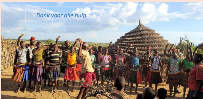
Dank voor alle hulp...