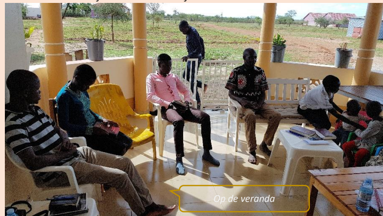
Op de veranda

God hun fouten niet zien? Het zijn boeiende dagen op de veranda, en ondertussen letten we op de prachtige vogels die voorbij vliegen. Ze zijn aanleiding tot een goed gesprek over het rentmeesterschap van de mens. In de eerste plaats kerk en overheid. Wat wordt er gezegd over klimaatverandering en wat wordt daarmee gedaan? In welke landen nemen presidenten dit vraagstuk serieus, en waar nauwelijks of niet? Waar gaat economie vóór ecologie en wie profiteert vooral? We hebben het over herderschap en wat dit betekent. Beide jongemannen van Nairobi hebben kuddes gehoeud in hun jeugd en leren ons enthousiast alles over het herderschap en hoe het werkt met de kudde. Ze weten goed te benoemen hoe een goede herder dat doet en wanneer er sprake is van een foute herder. Die kan zó fout zijn, dat je dit aan de schapen merkt. Ze luisteren niet naar zo'n herder. Prachtig om dergelijke voorbeelden op kerk en maatschappij te leggen en